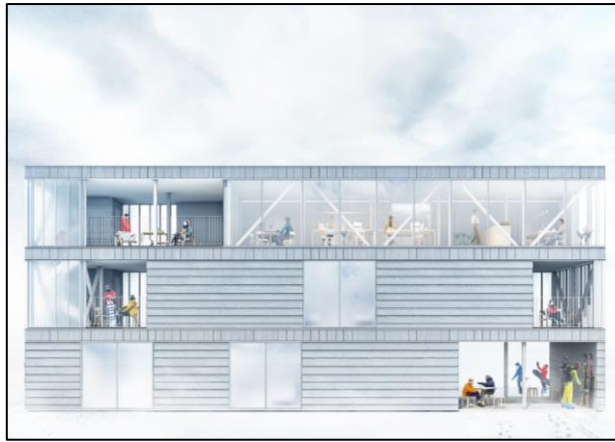
建築イメージパース