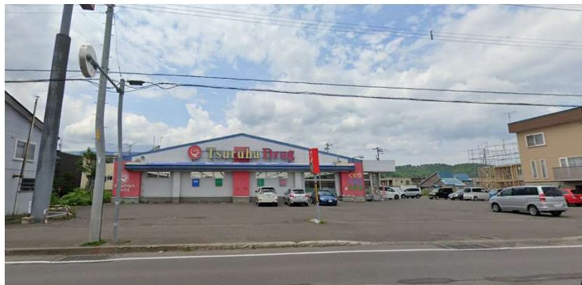
長年営業中、駐車場も広く、集客力のあるドラッグストア