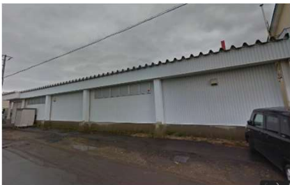
食品も販売、広い店舗(裏側)