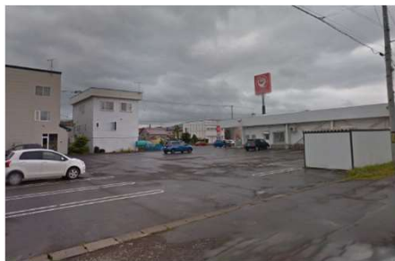
裏側からも駐車場に入れる立地の良さ