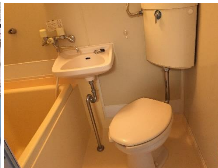
※写真は別部屋のイメージです。